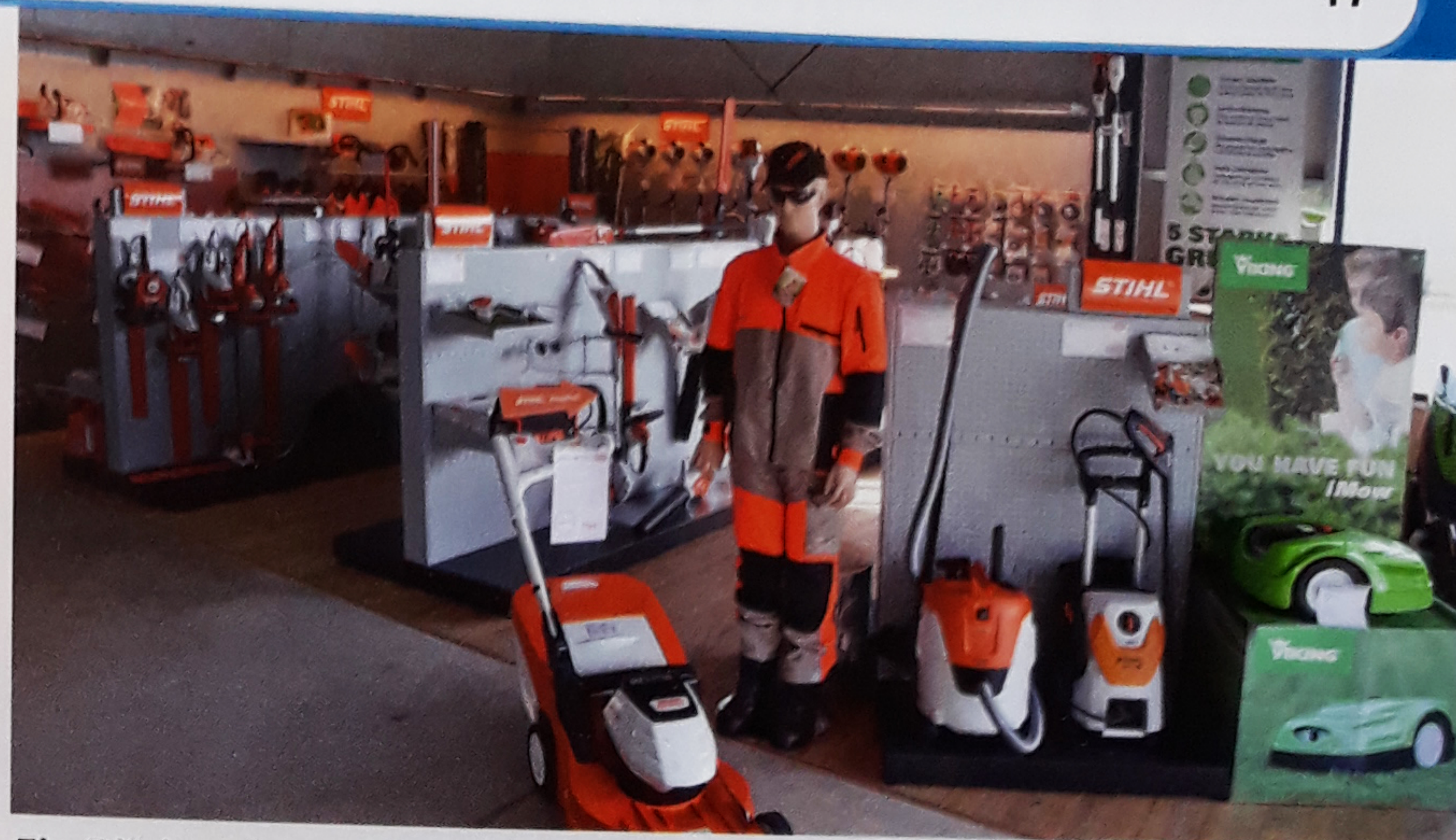
Ein Blick auf den neu gestalteten Markenshop STIHL und VIKING

(Telefon 05022-1012 oder cprange@boese-wietzen.de)